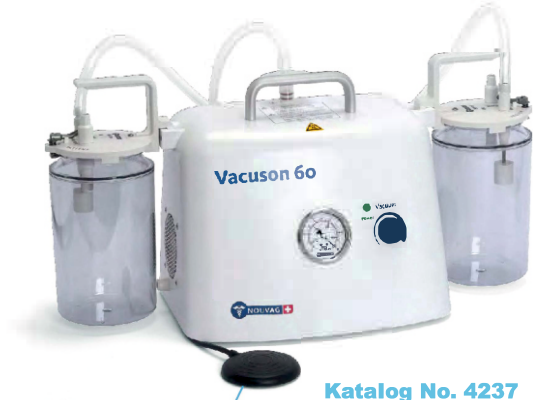
Katalog No. 4237

İhtiyaca bağlı olarak, Vacuson 60 veya VEXIO Cart cihaz arabasının şişe tutucularına iki adet 2 litrelik salgı şişesi veya iki adet 5 litrelik salgı şişesi asılabilir. MONOKIT sistemi ile, tek kullanımlık torbalarla çalışmak ve böylece temizleme ve yeniden işleme çabasını azaltmak da mümkündür.