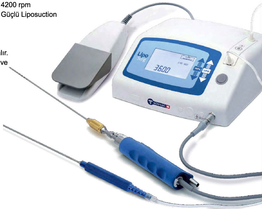
Katalog No. 3392

400 ml/dk infiltrasyon 4200 rpm Güçlü Liposuction