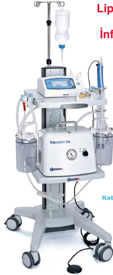
Katalog No. 4237